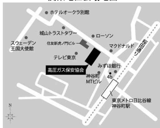
関東地区会場地図