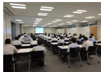
平成28年度のセミナーの様子

そこで、改正された規格の意図、具体的にどのようなことを考えていくと良いのかを、例を示し、逐条で従来の規格とも比較しながら説明することで、円滑な認証移行が確実に行われるよう、実務的な視点を重視した「2015改正ISO規格の詳細解説セミナー」を昨年度に引き続き開催します。