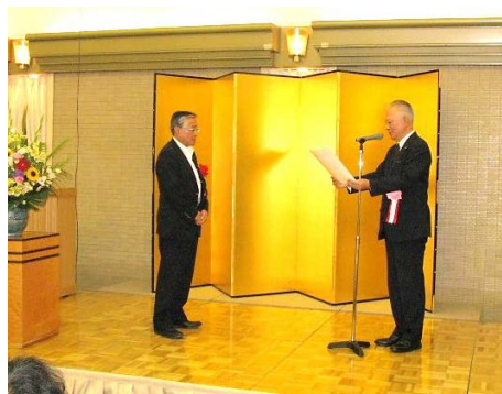
表彰状授与の様様