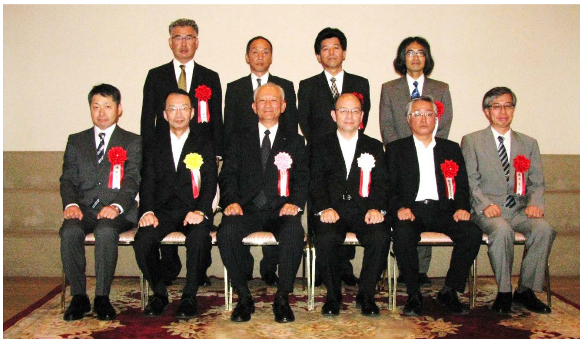
受賞者を囲んでの記念撮影