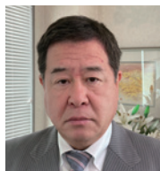
沼津酸素工業株式会社 代表取締役