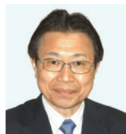
高野ガス株式会社 代表取締役社長