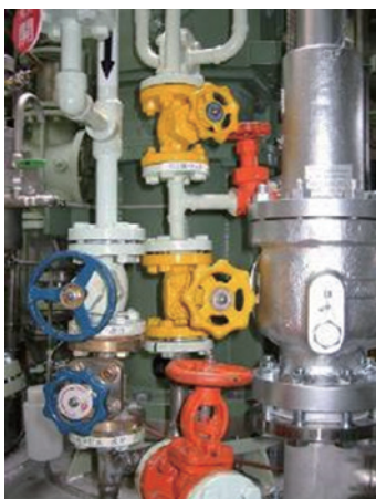
写真 3 バルブ塗装

3 例目は、備品置場 (写真 4) の一元化である。工場内で使用している口径、材質ごとに分け、一括管理を行っている。一括管理することにより、必要なものがすぐ見つかる。その結果、探すというむだな時間を削減する