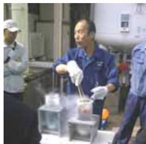
液化酸素・窒素ガス実験 クローラーからの窒素ガスの受入

翌日の9日は、大陽日酸(株)多賀城事業所において実際にCEの受入作業を体験し、併せて超低温ガスの特性や性質等を理解するため、実験やビデオによる実習を行いました。【実習風景は右図を参照】